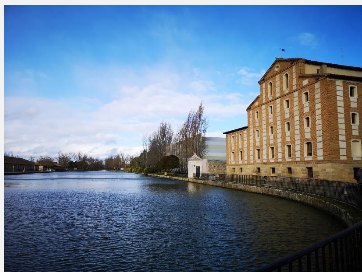
Docul Canalului Castiliei, Medina de Rioseco, Spania

Promovarea sustenabilității sociale și culturale: prin