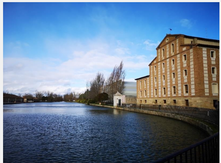
Doca do Canal de Castela, Medina de Rioseco, Espanha,

Preservar os recursos naturais e a biodiversidade: práticas empresariais sustentáveis são vitais para garantir que estes recursos sejam utilizados de forma responsável e preservados para as gerações futuras. Incentivar as empresas locais a adotarem abordagens amigas do ambiente ajuda a mitigar os danos ecológicos, enquanto permite o crescimento económico contínuo,