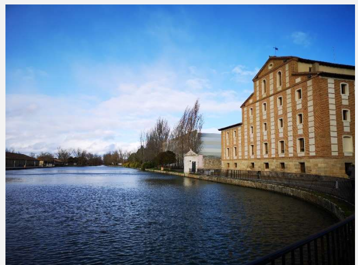
Dársena del Canal de Castilla, Medina de Rioseco, España

Promoviendo la sostenibilidad social y cultural: al empoderar a los empresarios y artesanos locales, reivindicamos el patrimonio cultural de las regiones ligadas a cursos de agua,