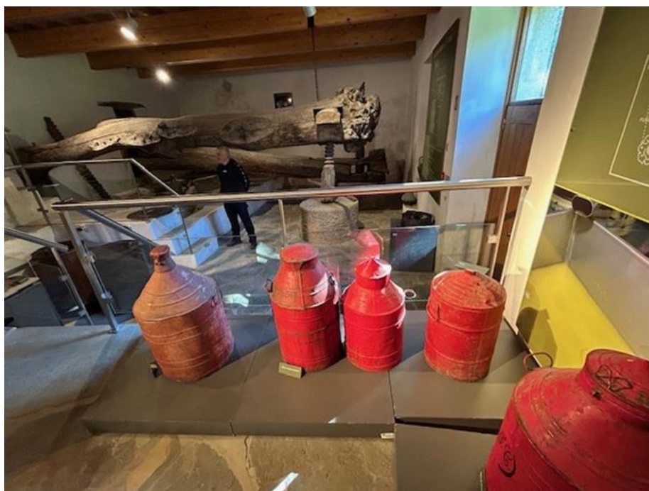
Mlin Varas v Vili Velha de Ródão, Portugalska

Več informacij o projektu MODRI TURIZEM: