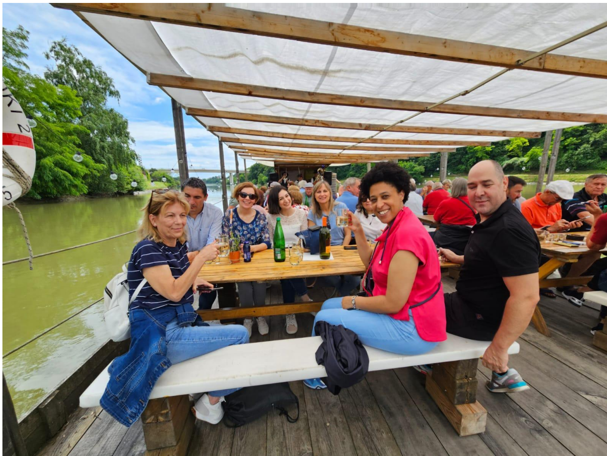
Imagen: Los socios del proyecto abrazan la cultura eslovena: Aventura tradicional de rafting en la penúltima reunión.

activa de la comunidad local. Tras la travesía, los socios saborearon un almuerzo de origen local, artísticamente preparado por una cooperativa de mujeres.