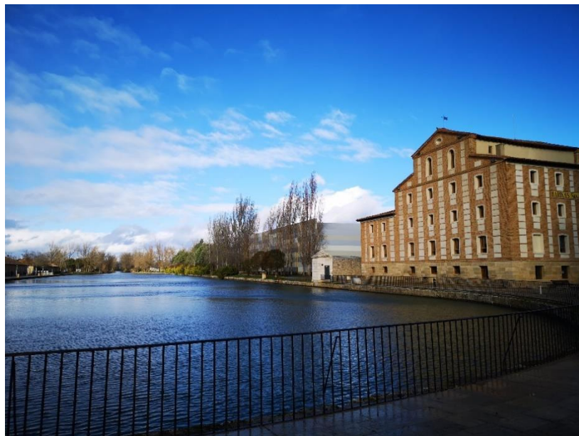
Doca do Canal de Castela em Medina de Rioseco (província de Valladolid, Espanha)

As regiões de cursos de água, caracterizadas pelos seus rios, lagos e outros, há muito são destinos procurados por viajantes que procuram tranquilidade e beleza natural. No entanto, a crescente popularidade dessas áreas tem criado alguns desafios para manter seu equilíbrio ecológico e salvaguardar o bem-estar das comunidades locais. O projeto BLUE TOURISM pretende promover a sustentabilidade nas regiões ribeirinhas e revolucionar a forma como o turismo opera nestas zonas. Reconhecendo a importância vital de preservar nossos recursos naturais e apoiar as comunidades locais, o projeto continua a trabalhar para desenvolver ferramentas inovadoras que impulsionam práticas de turismo sustentável.