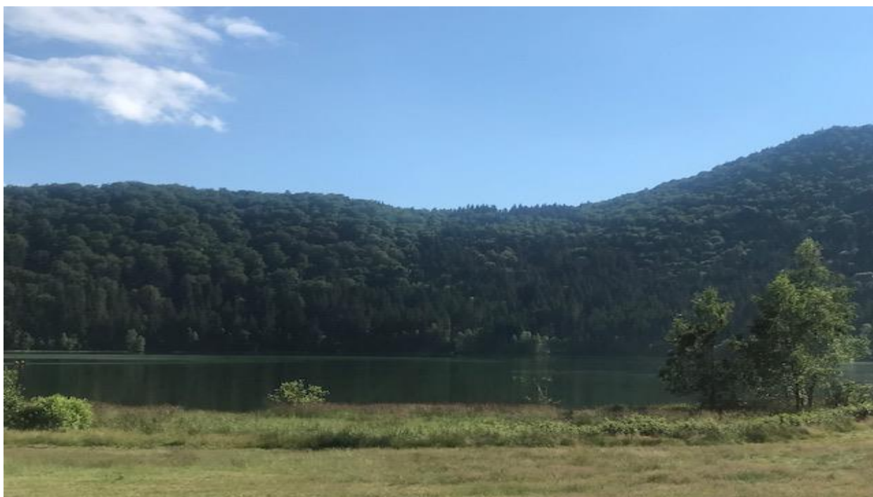
Lago Saint Anna, condado de Harghita, Rumanía

El objetivo de las formas sostenibles de turismo es la gestión eficiente de los recursos naturales, el respeto a las comunidades locales y el desarrollo de actividades económicas justas a largo plazo. Para hacer una pequeña contribución a esta transición masiva hacia la sostenibilidad, los socios de seis países están trabajando para desarrollar herramientas útiles en el marco del proyecto BLUE TOURISM, sobre el que podrá conocer más a través de nuestro boletín informativo.